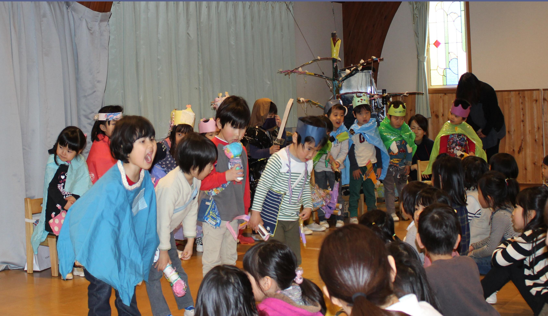
子どもたちのイメージを 年齢に沿った形で表現しています。